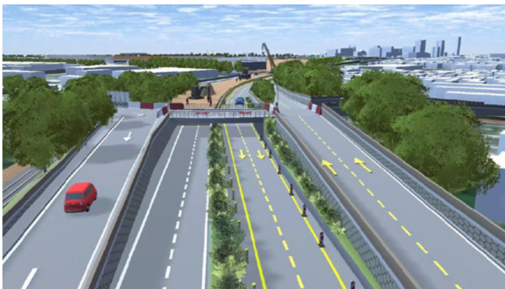
Vue du sens A13 > Rouen depuis la voie rapide Sud III, au niveau de l'échangeur Stalingrad à Petit-Quevilly.